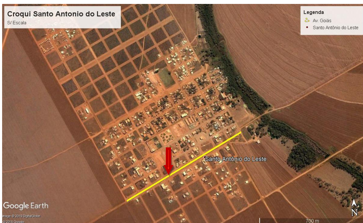
Figura 1: Localização da obra.

A obra esta implantada dentro do perímetro urbano da cidade de Santo Antônio do Leste - Mato Grosso, precisamente na extensão total do canteiro Central da Av. Goiás entre os Bairros Centro e Jardim Santa Inês, conforme Figura 1.