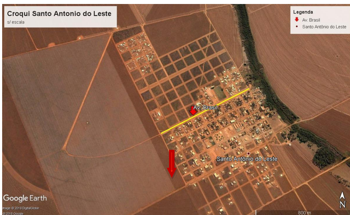
Figura 1: Localização da obra.

A obra esta implantada dentro do perímetro urbano da cidade de Santo Antônio do Leste - Mato Grosso, precisamente na extensão total do canteiro Central da Av. Brasil entre os Bairros Centro e Novo Campo, conforme Figura 1.