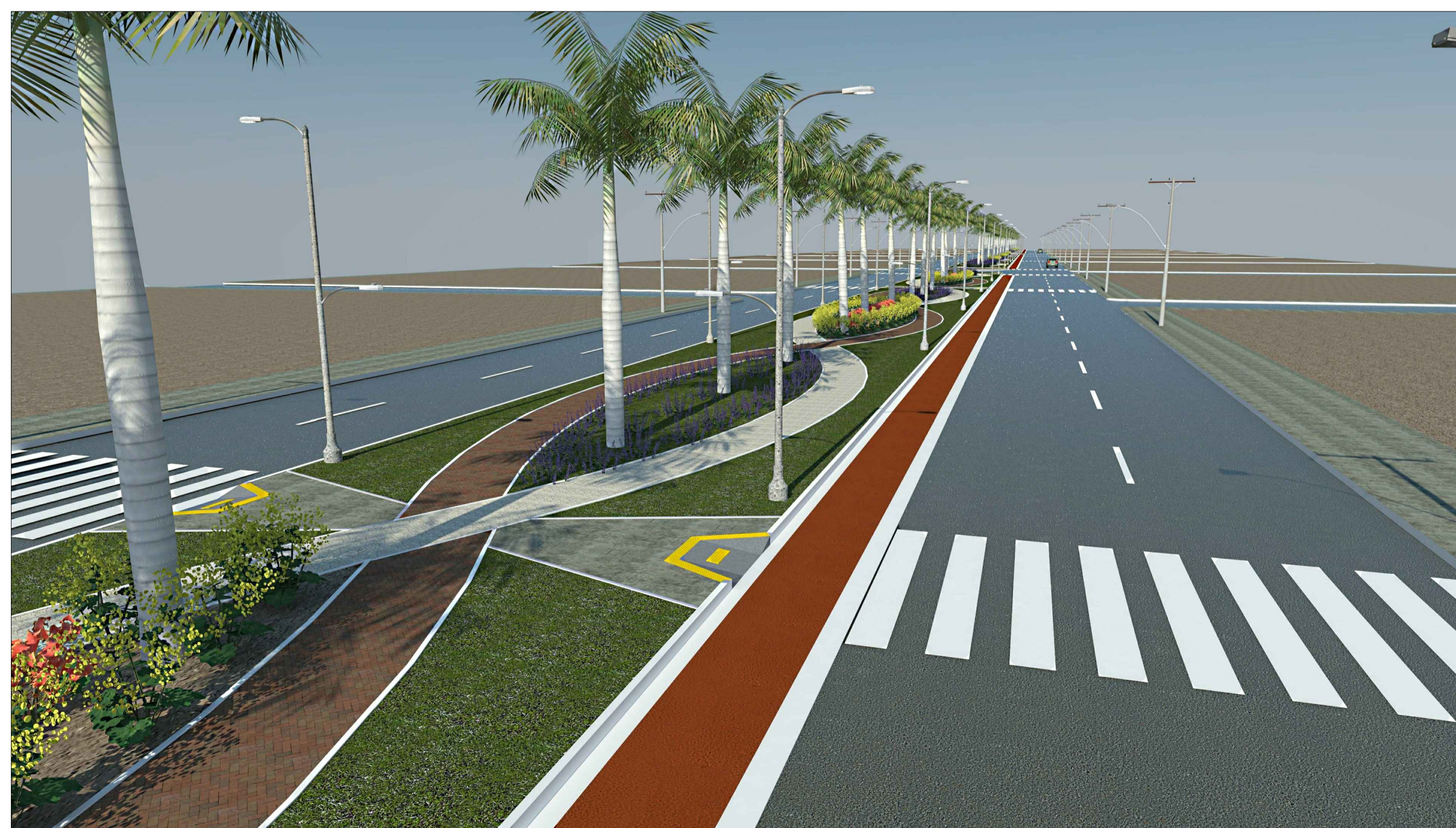
01 IMAGENS DA OBRA S/ESCALA