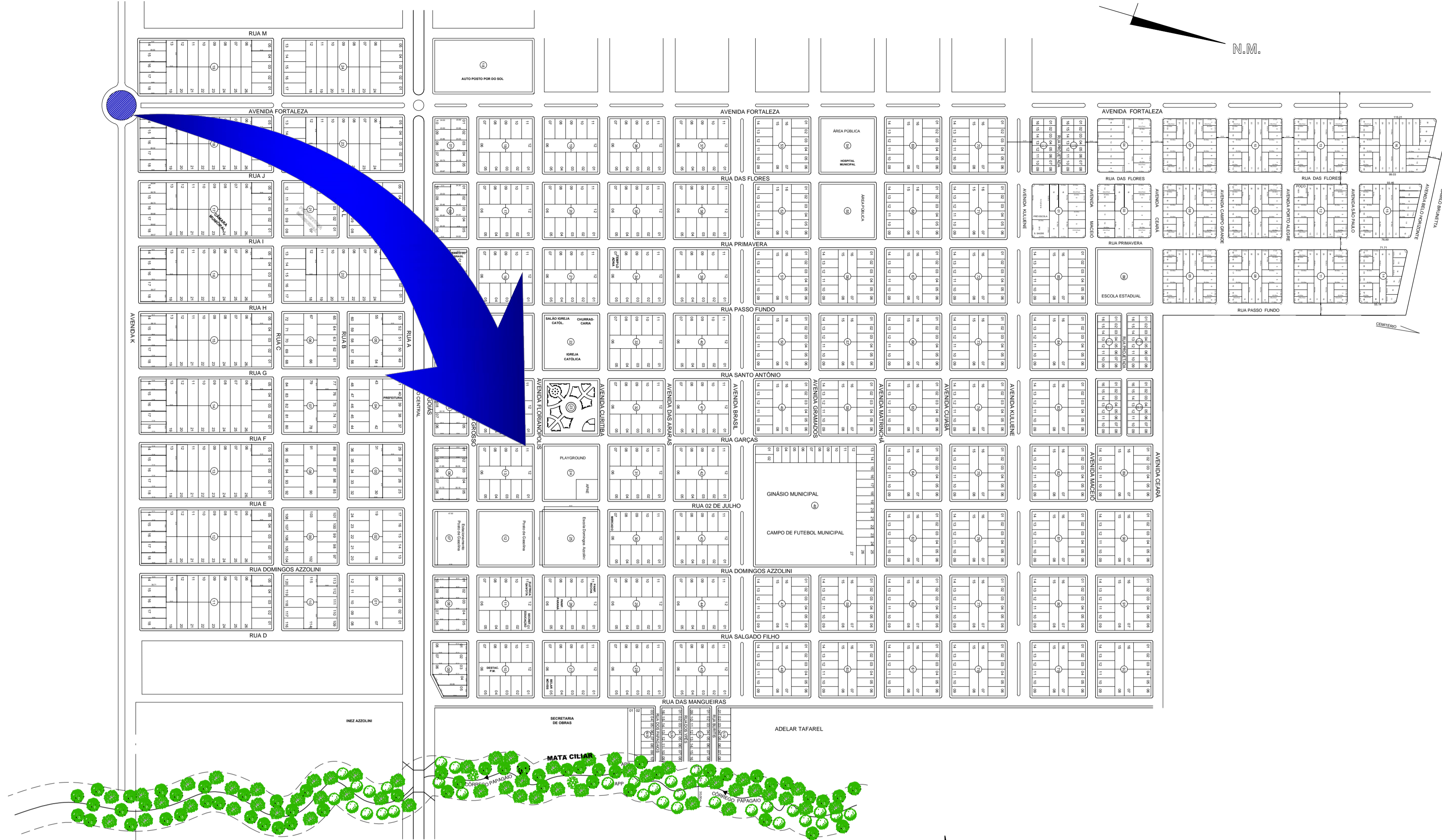
MAPA DA CIDADE SANTO ANTONIO DO LESTE - MT ESCALA 1 : 4500