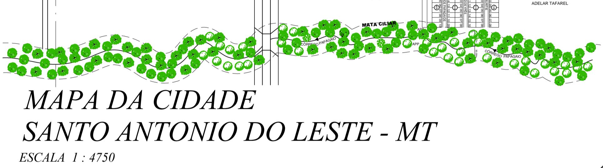
MAPA DA CIDADE SANTO ANTONIO DO LESTE - MT ESCALA 1 : 4750

O MUNICÍPIO DE SANTO ANTONIO DO LESTE ENCONTRA-SE NA MESOREGIÃO 4 (NORDESTE)- MATOGROSSENSE À MICRORREGIÃO 120, DENOMINADA CANARANA, DISTANTE DA CAPITAL DO ESTADO, CUIABÁ CERCA DE 367KM, VIA BR-070. A CIDADE, SEDE DO GOVERNO MUNICIPAL LOCALIZA-SE À RN: 639M, LATITUDE 14°49'09" E LONGITUDE: 53°37'09".