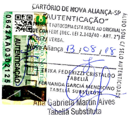
SEBASTIÃO DE SOUZA ROLIM