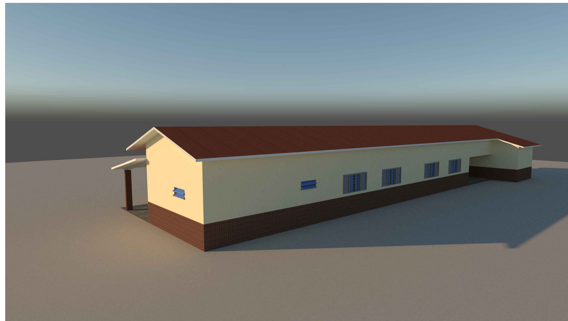
02 VISTA FUNDOS S/ ESCALA