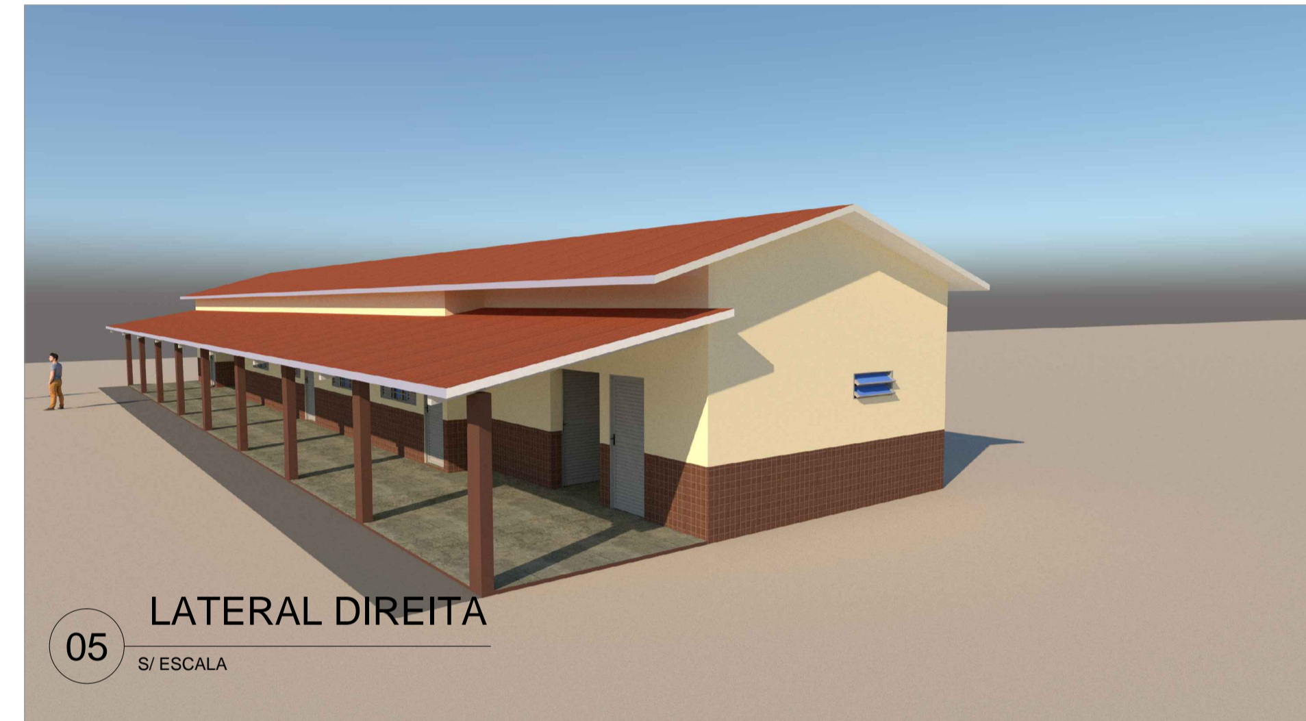
05 LATERAL DIREITA S/ ESCALA