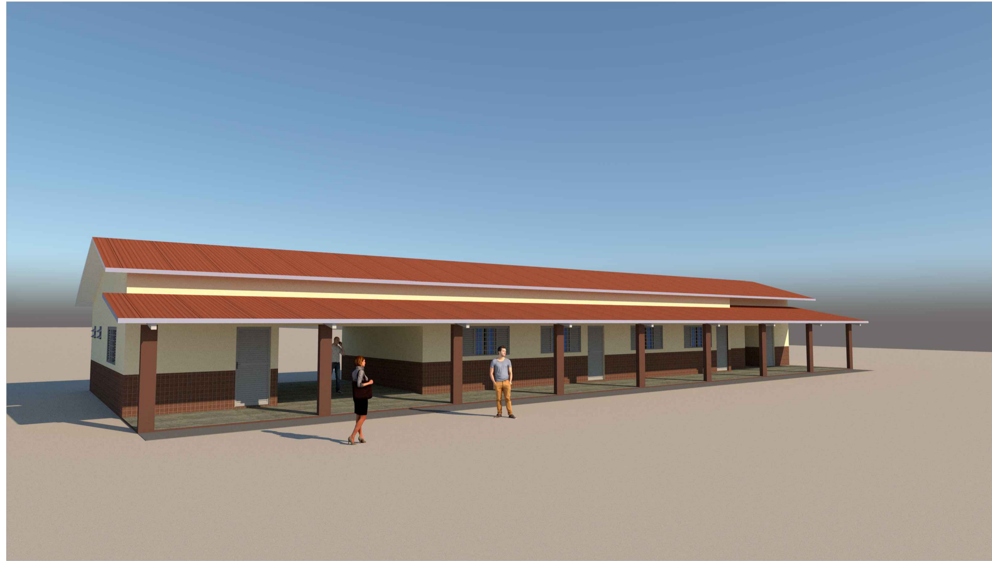
03 FACHADA FRONTAL S/ ESCALA