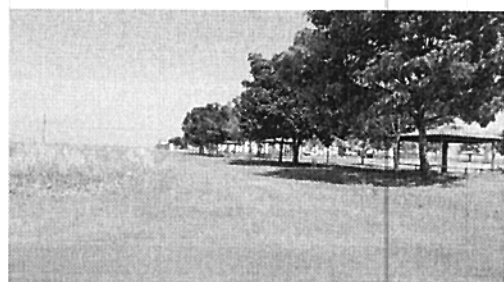
Av. Gramados (Comentários, coordenadas, etc.)