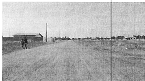
Rua Passo Fundo (Comentários, coordenadas, etc.)