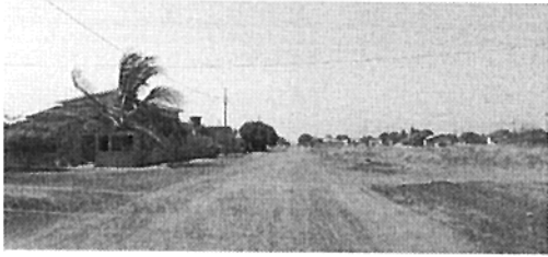
Rua Passo Fundo (Comentários, coordenadas, etc.)

(Legenda) (Comentários, coordenadas, etc.)