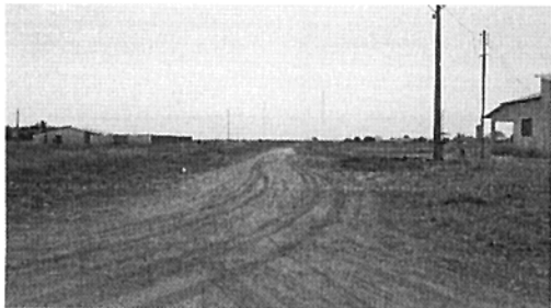
Av. Cuiabá (Comentários, coordenadas, etc.)