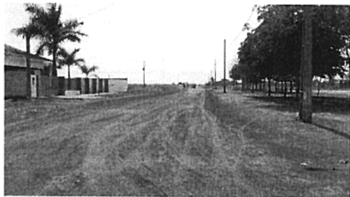
Av. Matrinchã (Comentários, coordenadas, etc.)