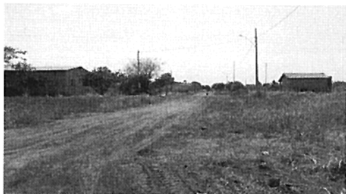
Rua Passo Fundo (Comentários, coordenadas, etc.)