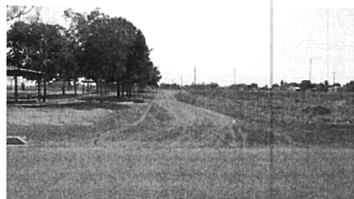
Av. Gramados (Comentários, coordenadas, etc.)