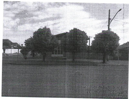
Figura 02 – Fachada Av. Mato Grosso