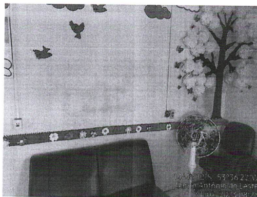
Figura 04 – Parede com infiltração e mofo