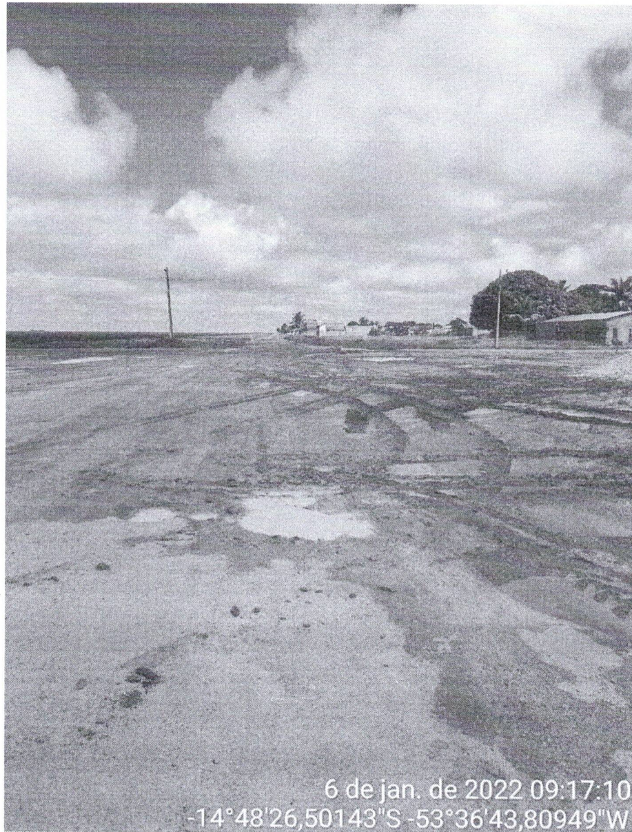
Figura 02 – Ponto 01

O ponto 1 se inicia no cruzamento com a Av. Goiás, logo na entrada da cidade;