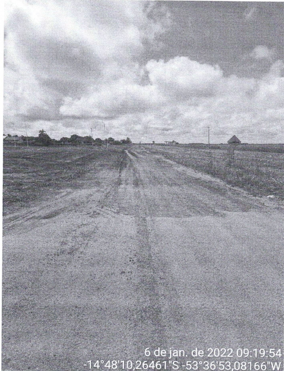
Figura 03 - Ponto 02

A Av. Fortaleza segue por 6 quadras até fazer cruzamento com a Av. Gramados, onde se inicia um pequeno trecho pavimentado.