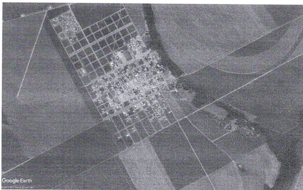
Figura 02 – Vista Geral do Município.