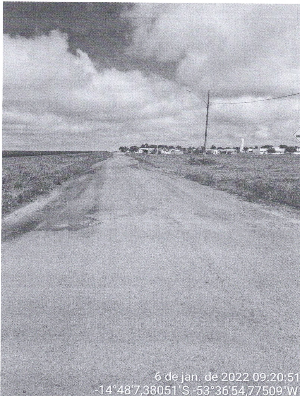
Figura 04 - Ponto 03

A pavimentação termina no cruzamento com a Av. Matrinchã, e avança por mais duas quadras sem pavimentação;