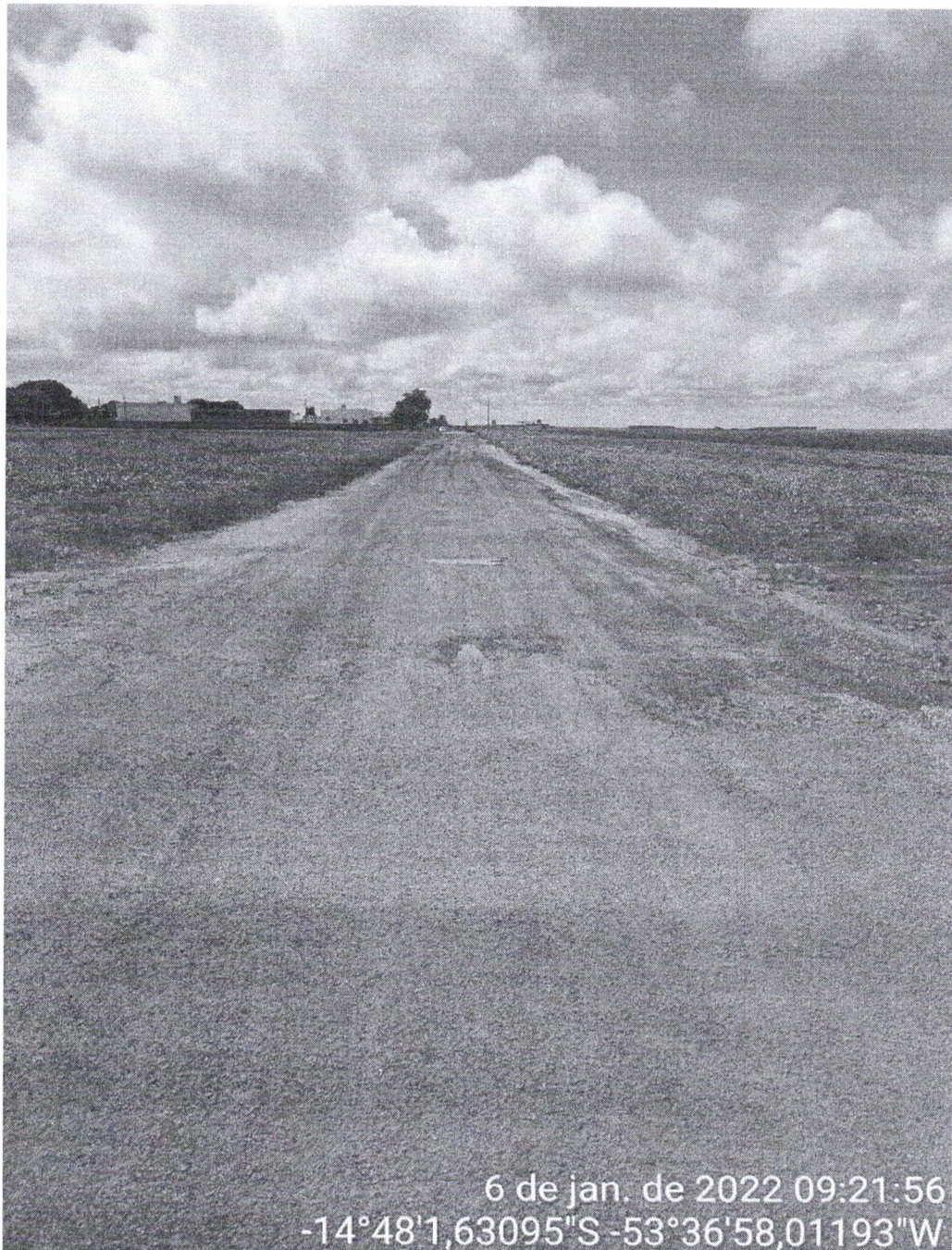
Figura 05 – Ponto 04

Por fim, no cruzamento com a Av. Kuluene termina-se o trecho sem pavimentação e registra-se o último ponto deste relatório fotográfico.