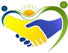
Figura 1- Imagem Ilustrativa.